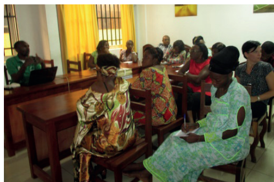
Séance de formation théorique du personnel d'Egis Cameroun avec les formateurs de la Croix rouge Camerounaise

C'est pourquoi, la direction générale d'Egis Cameroun, en tant qu'entreprise responsable, a décidé d'organiser une formation sur le thème des soins de premiers secours en faisant appel à la Croix-Rouge Camerounaise.