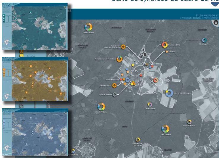
Cartes des valeurs du territoire exprimées par les habitants