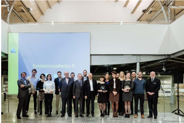
Remise des « Bourses Palladio 2017 » le 7 novembre 2017 lors de la 10 e Rentrée universitaire Palladio au Pavillon de l'Arsenal