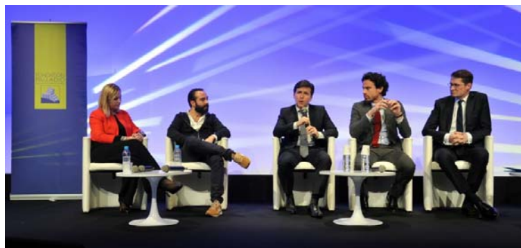
© SIMI2017 / Remise du 10 e « Prix Junior de l'immobilier et de la ville », parrainé par la Fondation Palladio, le 8 décembre 2017 lors du Salon SIMI au Palais des Congrès de la Porte Maillot © SIMI2017 / Plénière du Salon SIMI 2017, coorganisée par la Fondation Palladio, sur « L'Intelligence artificielle dans nos écosystèmes : une nouvelle révolution »