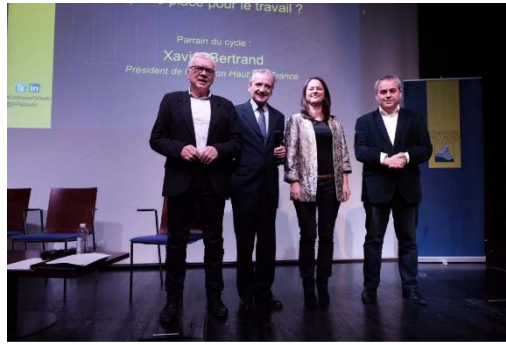
© Fondation Palladio / Visuel « Actes du cycle 2017 de l'Institut Palladio », 6 e numéro de la Collection © Nicolas Grout, Fondation Palladio / Passage de témoin entre Xavier Bertrand, parrain du cycle 2017, et Johanna Rolland, marraine du cycle 2018 le 22 novembre 2017 lors du Colloque annuel de l'Institut au Collège des Bernardins